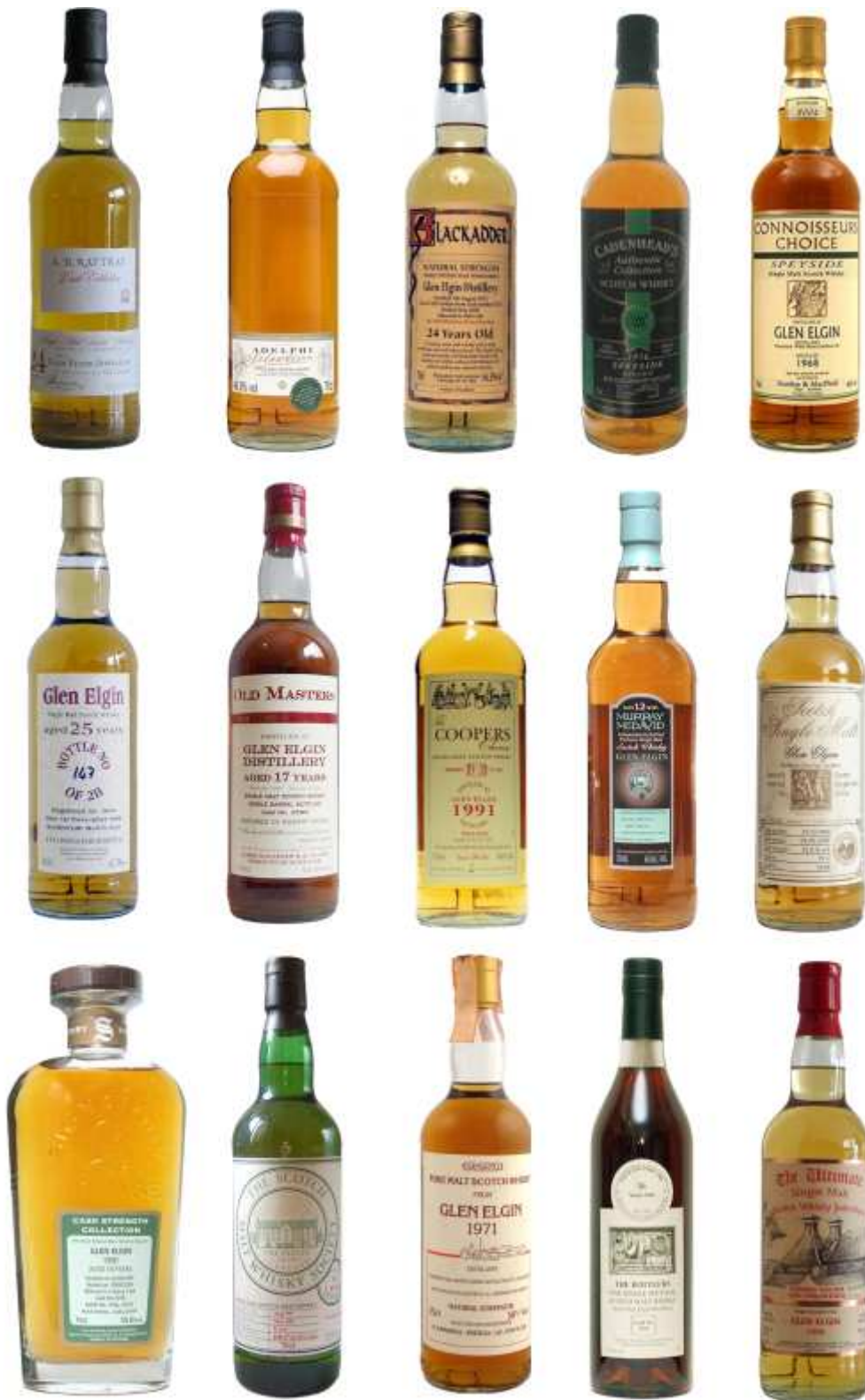
Quelques embouteillages indépendants de Glen Elgin