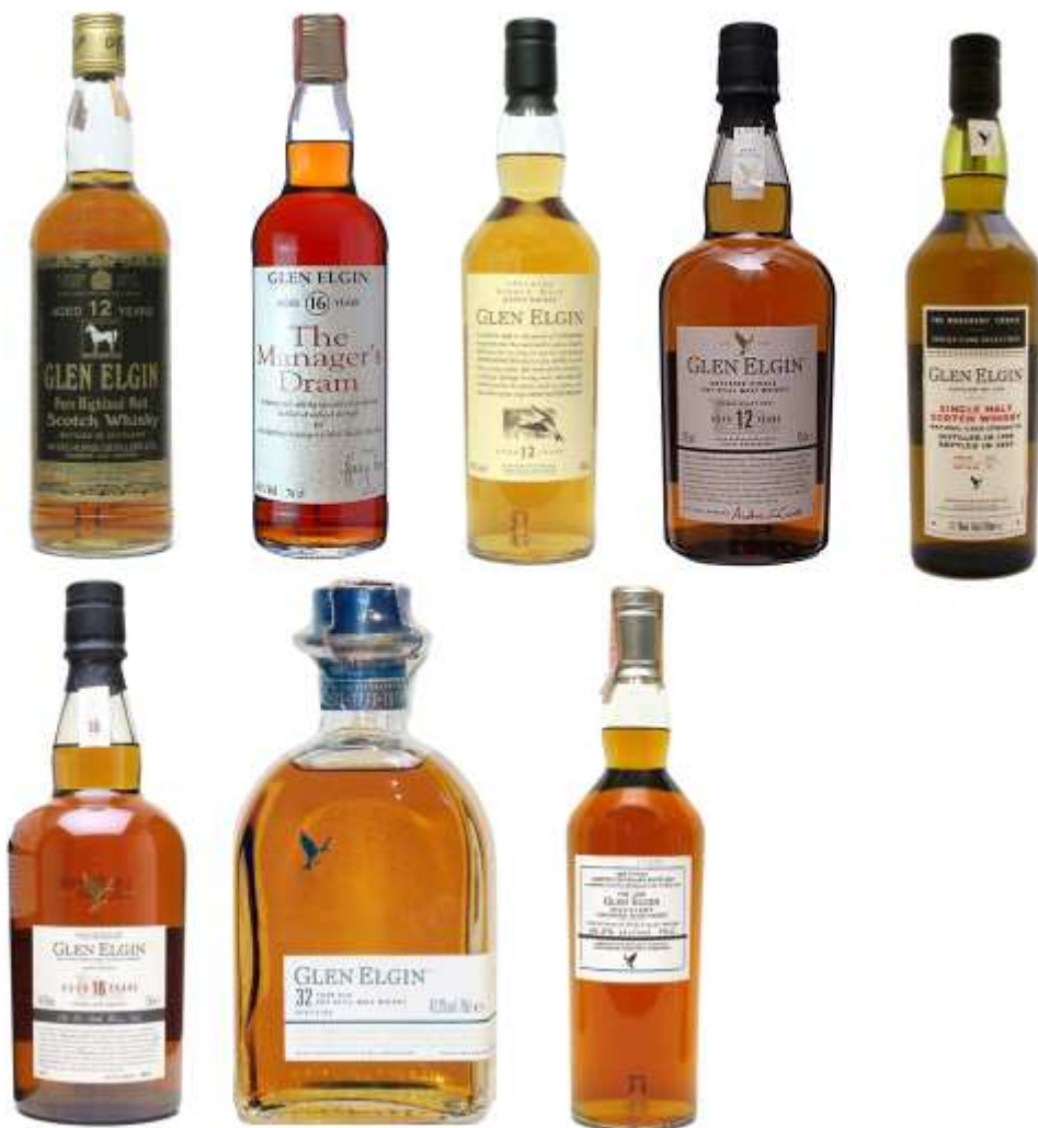
Quelques embouteillages officiels de Glen Elgin

Dans les versions plus rares, il existe un Glen Elgin « The Manager's Dram » sorti en 1993, un « Centenary Bottling » (2000) et un Glen Elgin 32 ans (2003).