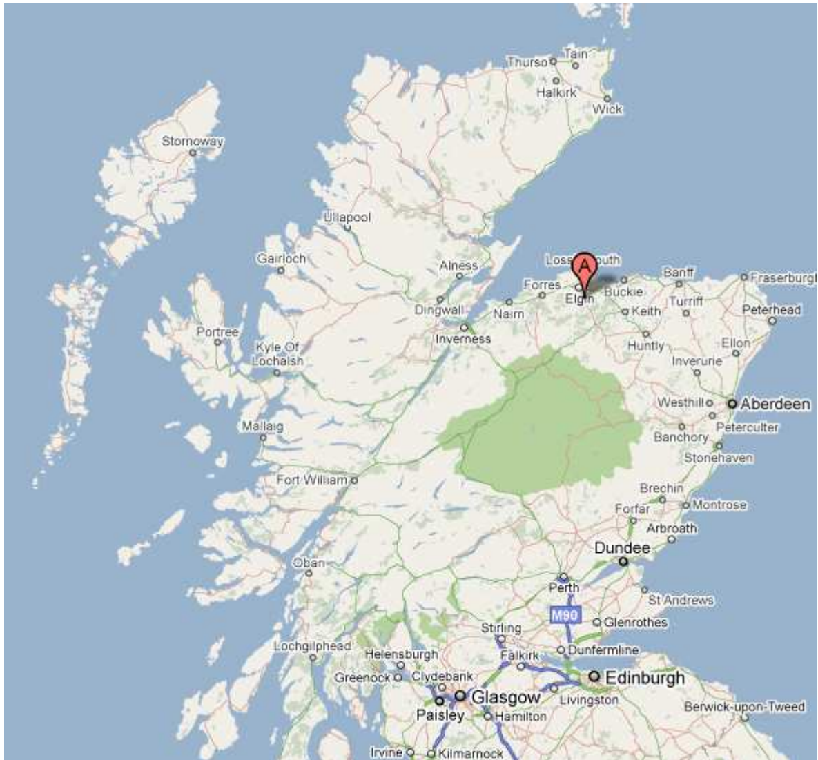
(Localisation de Glen Elgin)

A cet endroit où la rivière Lossie approche de la ville d'Elgin, il n'y a pas moins de huit distilleries (Benriach, Glenlossie, Glen Moray, Linkwood, Longmorn Mannochemore, Milntown et Glen Elgin) dans un rayon de quelques kilomètres. Malgré son nom, Glen Elgin est de ces huit, la distillerie la plus éloignée d'Elgin.