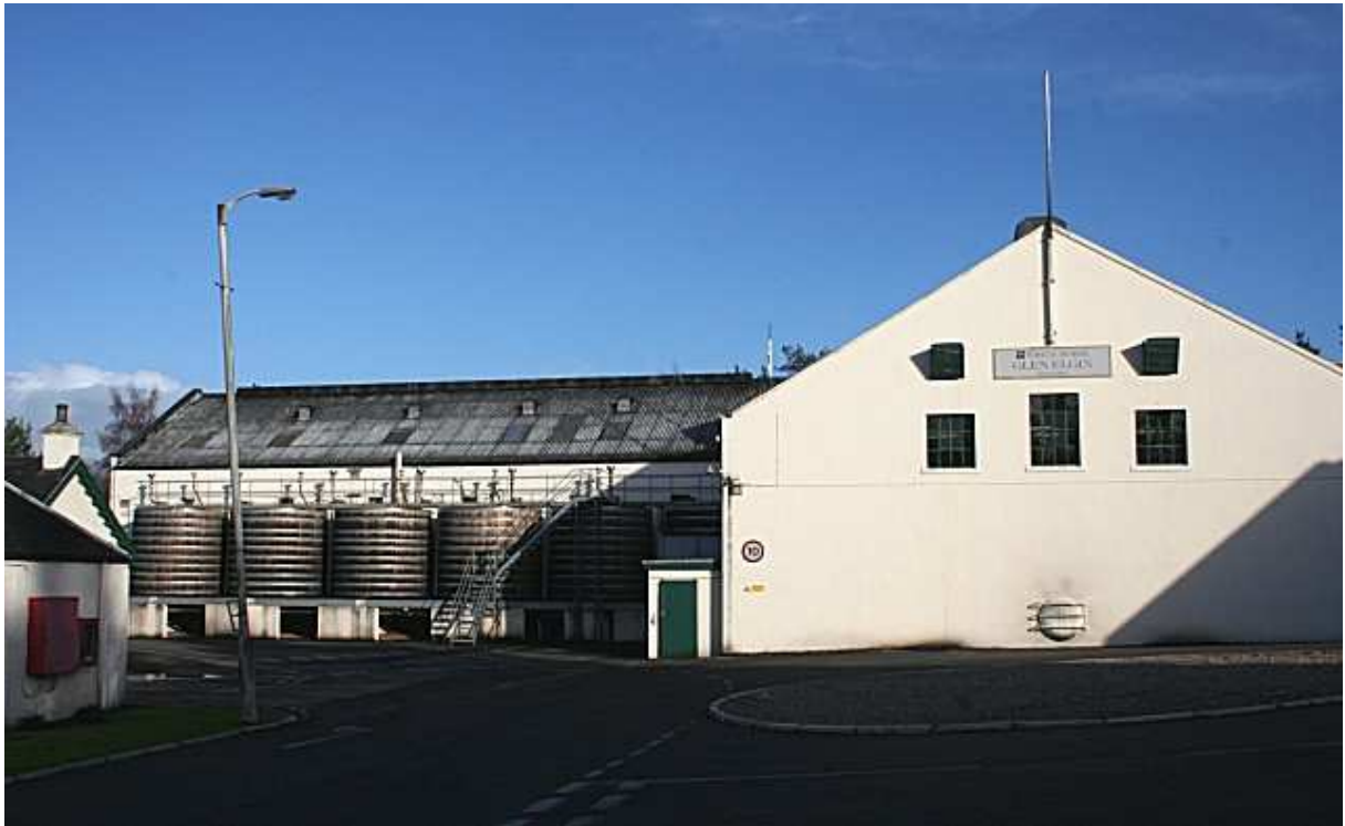
La distillerie Glen Elgin